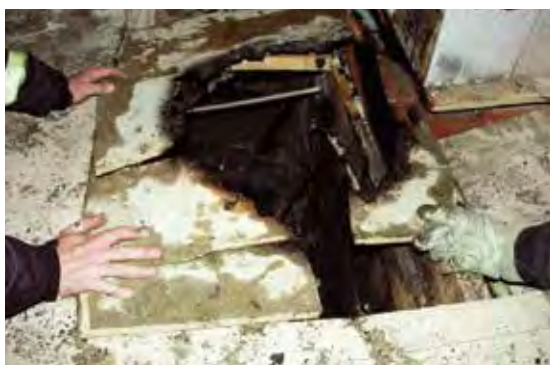
Felaktigt hanterad aska är en vanlig brandorsak. Här har golvet brunnit när aska från en kakelugn som det eldats i dagen före ställts i en plastpåse på golvet.

Bränder i bostäder är ofta eldstadsrelaterade. Därför är det viktigt att uppmärksamma säkerheten kring eldstäder. De boende behöver informeras om vad som gäller för de lokala eldstäder som finns i fastigheten, exempelvis kakelugnar och öppna spisar. Viktig information är om det får eldas i dessa, vad som i så fall får eldas, i vilken omfattning det får eldas och hur askan ska hanteras.